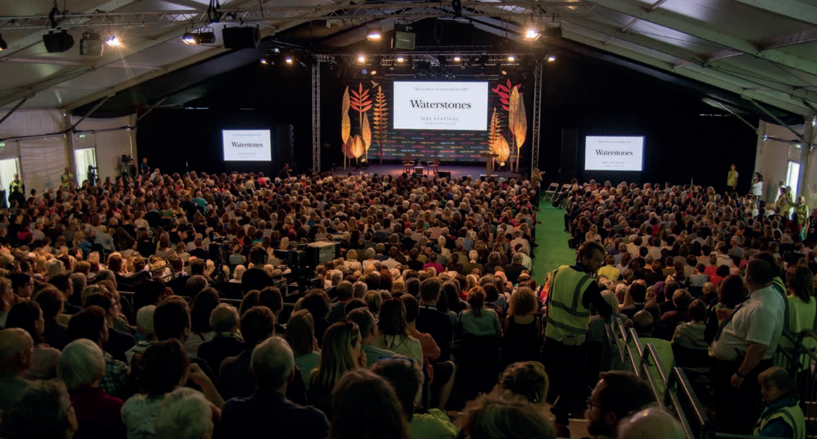
Hay Festival Wales audience